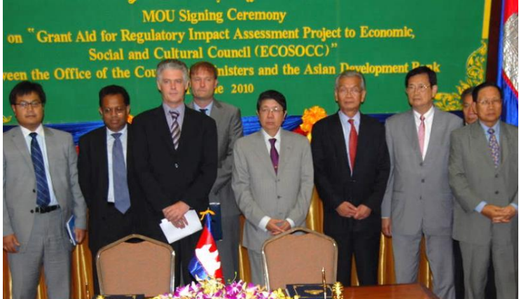
សម្តេចវិបុលបញ្ញា សុខ អាន ពិធីចុះMoUជាមួយADB បង្កើតគម្រោងRIA ឆ្នាំ២០១០