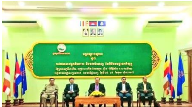
ឯកឧត្តម ឃឹម ណុលសន អនុប្រធាន ECOSOCC បើកវគ្គបណ្តុះបណ្តាលនៅក្រសួងរ៉ែ និងថាមពល នៅខែមិថុនា ឆ្នាំ២០១៨

លទ្ធផលទី១ - កសាងធនធានមនុស្ស: ពីឆ្នាំ២០១១ដល់ ខែធ្នូ ឆ្នាំ២០១៨ បានបណ្តុះបណ្តាលមន្ត្រី ចំនួន ១២៩៨នាក់ (រួមដំណើរសិក្សាដកពិសោធន៍នៅប្រទេសអូស្ត្រាលី អង់គ្លេស វៀតណាម កាណាដា ផងដែរ។