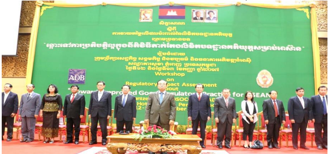
ឯកឧត្តមកិត្តិនីតិកោសលបណ្ឌិតឧបនាយករដ្ឋមន្ត្រីប្រចាំការ ប៊ិន ឈិន ឧបនាយករដ្ឋមន្ត្រីប្រចាំការ រដ្ឋមន្ត្រីទទួលបន្ទុកទីស្តីការគណៈរដ្ឋមន្ត្រី ជាអធិបតីភាពក្នុងពិធីបិទសិក្ខាសាលាអន្តរជាតិថ្នាក់តំបន់ស្តីពីRIA នៅរាជធានីភ្នំពេញ ថ្ងៃទី១២ ខែកញ្ញា ឆ្នាំ២០១៧

ដោយក្រុមប្រតិបត្តិលិខិតបទដ្ឋានគតិយុត្តក្រោមការដឹកនាំពី ឯកឧត្តមទេសរដ្ឋមន្ត្រី យឹម ណុលឡា ឯកឧត្តម យឹម ណុលសន និងការគ្រប់គ្រងដោយ ឯកឧត្តម ប៊ិច សុខា។ ធនាគារអភិវឌ្ឍន៍អាស៊ី បានបន្តជួយឧបត្ថម្ភជំនួយបច្ចេកទេស (TA) រហូតដល់ខែមិថុនា ឆ្នាំ២០១៩។