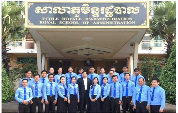
ឯកឧត្តម ប៊ុន សុខាអគ្គលេខាធិការរង ECOSOCC បើកវគ្គបណ្តុះបណ្តាលនៅសាលាមន្ត្រីរដ្ឋបាល នៅខែកុម្ភៈ ឆ្នាំ២០១៧