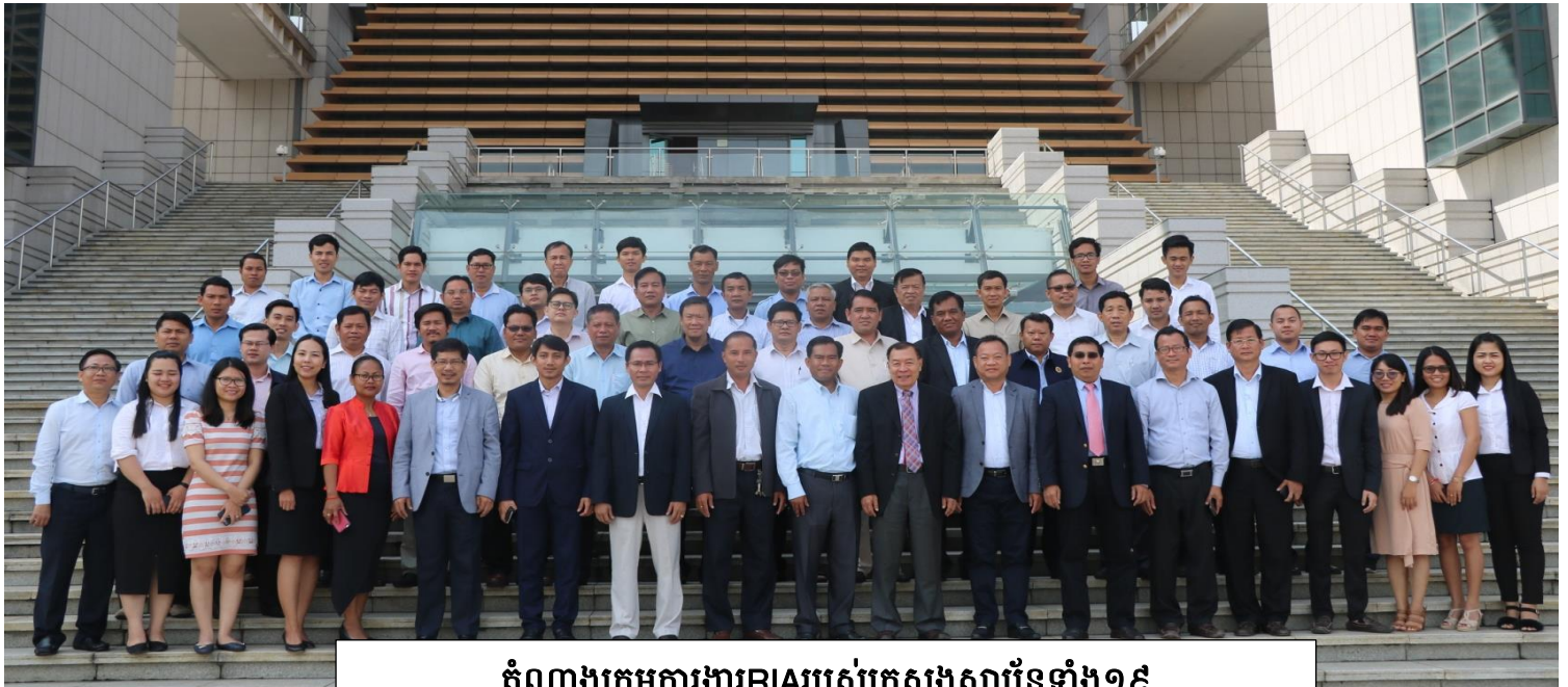
តំណាងក្រុមការងារ RIA របស់ក្រសួងស្ថាប័នទាំង១៩